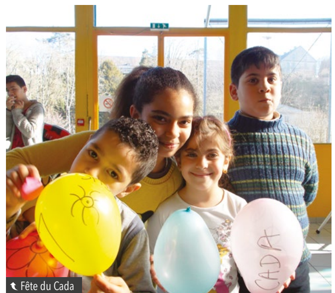
↑ Fête du Cada

Depuis quelques années l'intégration vers le logement ne pose pas de difficulté majeure en raison d'un fort partenariat avec les bailleurs sociaux et un marché de l'immobilier non saturé. L'accès à la formation linguistique est rapide dès signature du CAI. Par contre, au vu de la conjoncture actuelle, l'accès à l'emploi et à la formation qualifiante sont de plus en plus restreints. Aujourd'hui, même les chantiers d'insertion sont saturés par les candidatures, et les recrutements se font de plus en plus rares.