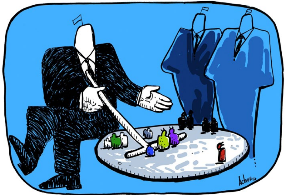
L'accueil des demandeurs d'asile en Europe vu par Achou

Europe, immigration : un refrain trop connu !